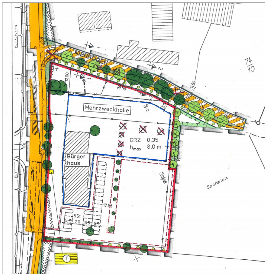
Rechtskräftiger Bebauungsplan Nr. 15